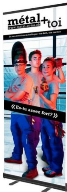
team constructeur métallique CFC