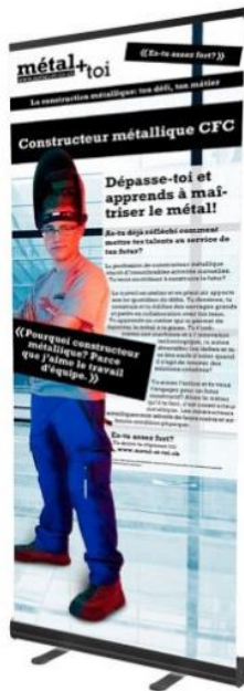
Constructeur métallique CFC

En prêt : roll-up „métal+toi“ petit, 85x215 cm / 10pro